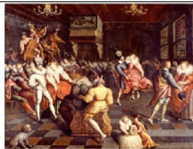
Bal à la cour des Valois