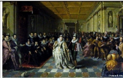
Le bal de nocce du duc de Joyeuse (1581)