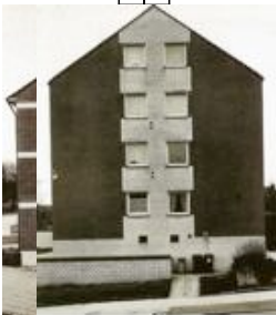
Bernd et Hilla BECHER Häuser , 2001, Photographies de façades de maisons, Galerie Renn, 14/16 Verneuil, Paris