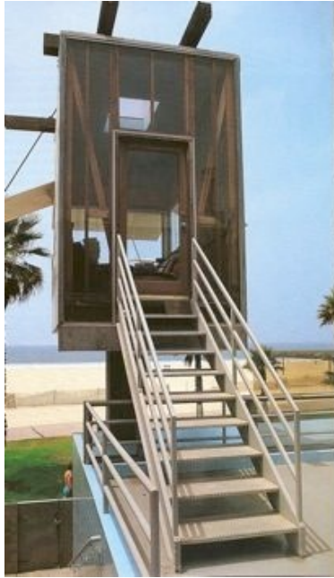
Frank O. GEHRY Maison pour la famille Norton ; Venice, Californie