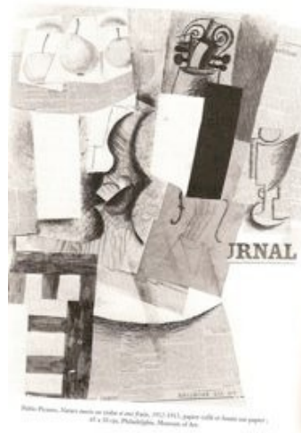
Pablo PICASSO Nature morte au violon et aux fruits , 1912-1913, papier collé et fusain/papier, 65 x50 cm, Museum of Art , Philadelphie.

Vous pouvez télécharger l'intégralité de cette séquence :