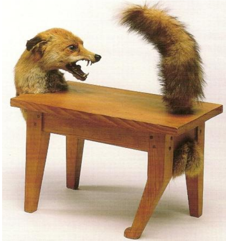
Victor BRAUNER Loup -Table , 1939-47, bois et renard naturalisé, 54x57x28.5 cm, MNAN, Paris.