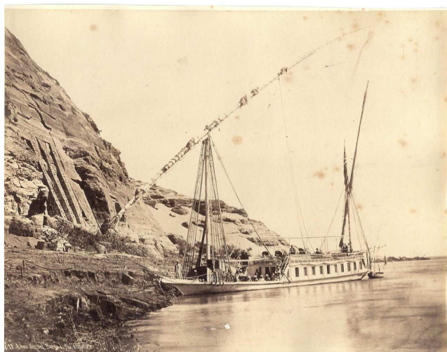
Une cange sur le Nil à Abou Simbel.

Photographies de l'exposition libres de droit disponibles sur demande.