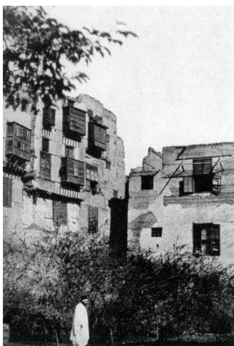
Gustave Flaubert dans le jardin de l'Hôtel du Nil au Caire, 9 janvier 1850, photographie de Maxime Du Camp

Tarifs : 10 € et 5 € (Amis du musée, personnel du CHU, 18-25 ans).