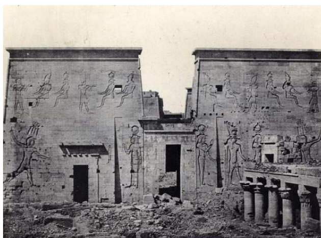
Maxime Du Camp, Temple de Philae