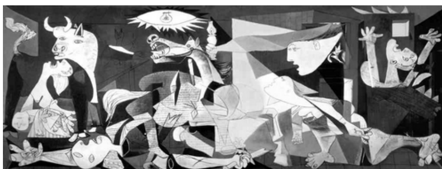
Pablo PICASSO, Guernica , 1937, huile sur toile, 349,1 x 776,6 cm, Musée de la Reine Sofia, Madrid.

« Non, la peinture n'est pas faite pour décorer des appartements ; c'est une arme offensive et défensive contre l'ennemi. »