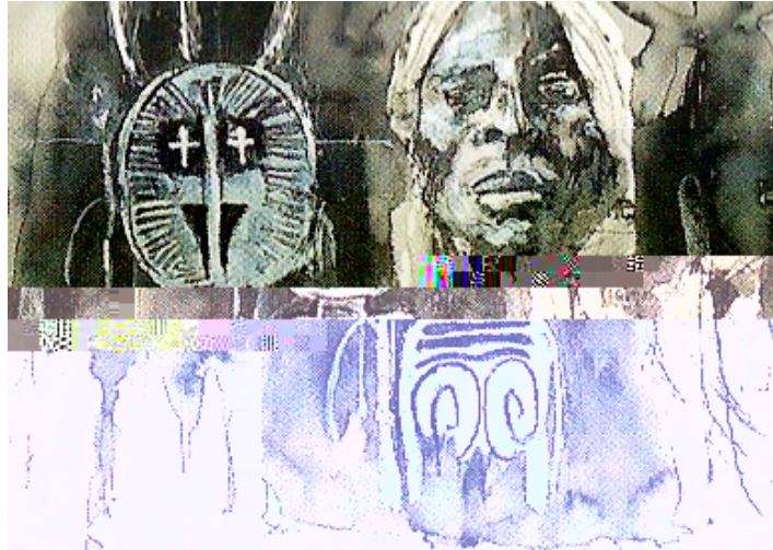
Patrick SINGH Carnet d'Afrique , Lavis, encre de chine, Carnet de voyage en Afrique.