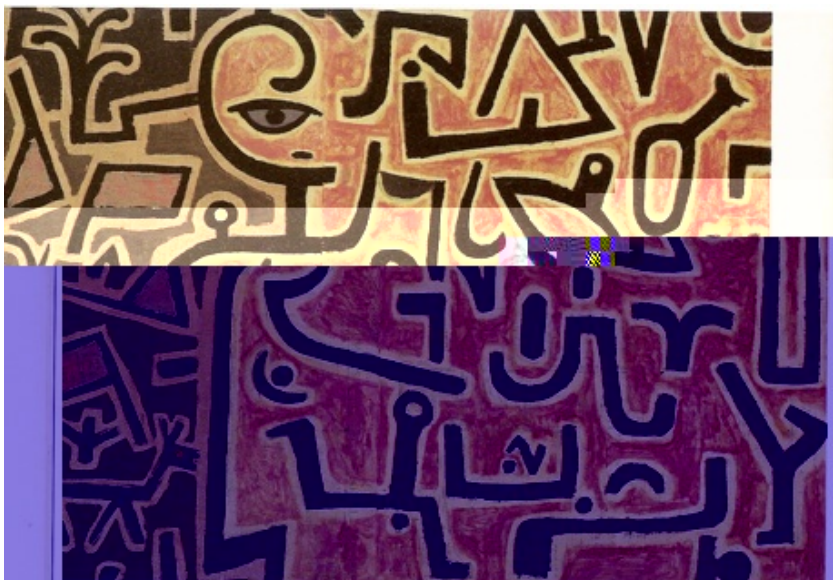
Paul KLEE Intentions , 1938, peinture à la colle et papier journal/ toile, Kunstmuseum, Berne.