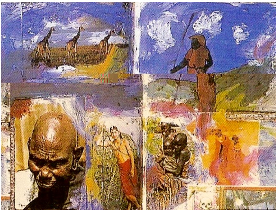
Dan ELDON The journey is the destination , 1993, photos, dessin, gouache issu Du journal de Dan Eldon, Edition Chronicle books.