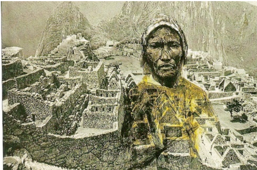
Patrick SINGH Carnet du Pérou , photo argentique, encre et aquarelle, carnet de voyage au Pérou.