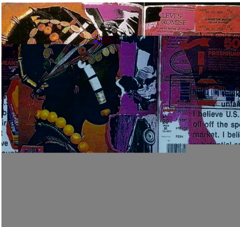
Dan ELDON Mogadiscio , 1993, cartes, dessin, collage, photos, Journal intime.