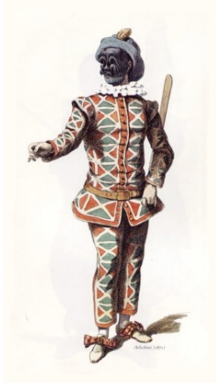
Document 1 : Arlequin du XVIIème , Maurice Sand, 1862