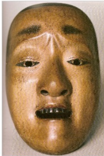
Chūjō, le jeune homme , milieu du XX e Siècle, bois sculpté, peint et laqué, 20.6 x 13.6 x 8 cm, Musée du quai Branly, Paris.