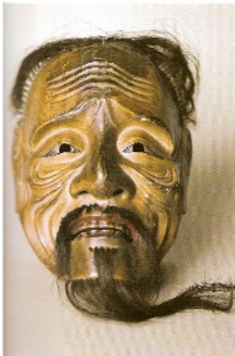
Sankōjō, le vieillard , bois sculpté, peint et Poils, 30x 16 x 11 cm, Musée du quai Branly, Paris.