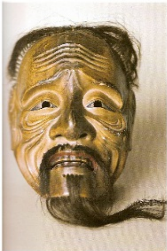
Sankōjō, le vieillard , bois sculpté, peint et Poils, 30x 16 x 11 cm, Musée du quai Branly, Paris.