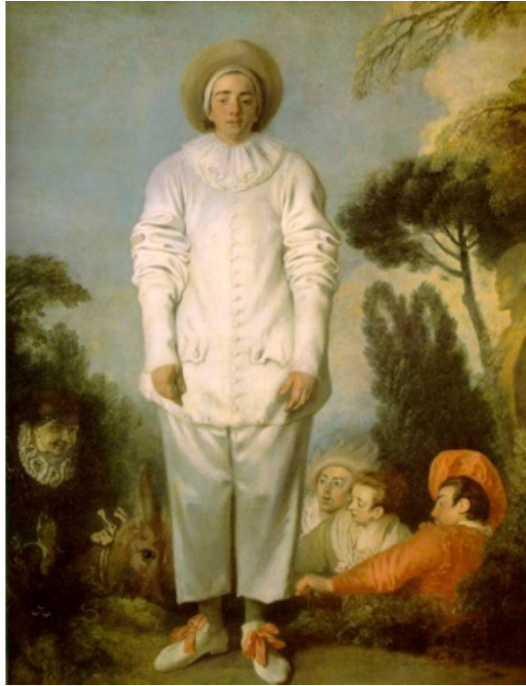
Document 5 : Pierrot, dit autrefois « Gilles » , Watteau, vers 1718-1719