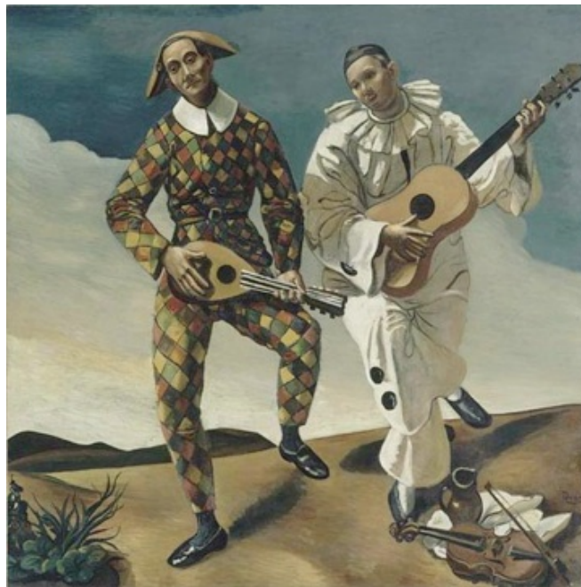
Document 4 : Arlequin et Pierrot , André Derain, 1924