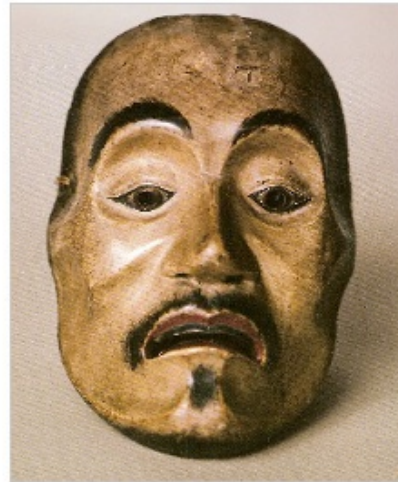
Yase-otoko, un esprit , bois sculpté, peint et laqué, 21x15 x 8 cm, Musée du quai Branly, Paris.