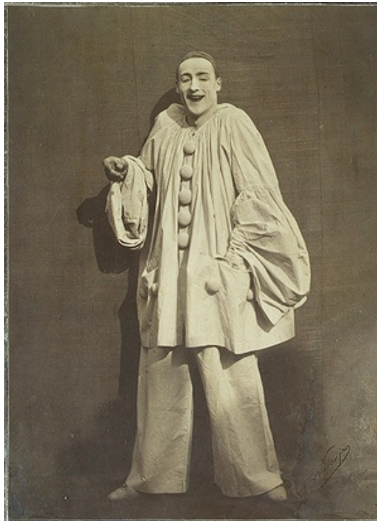
Document 2 : 1854-1855