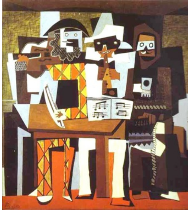
Document 3 : Les trois musiciens , Pablo Picasso, 1921