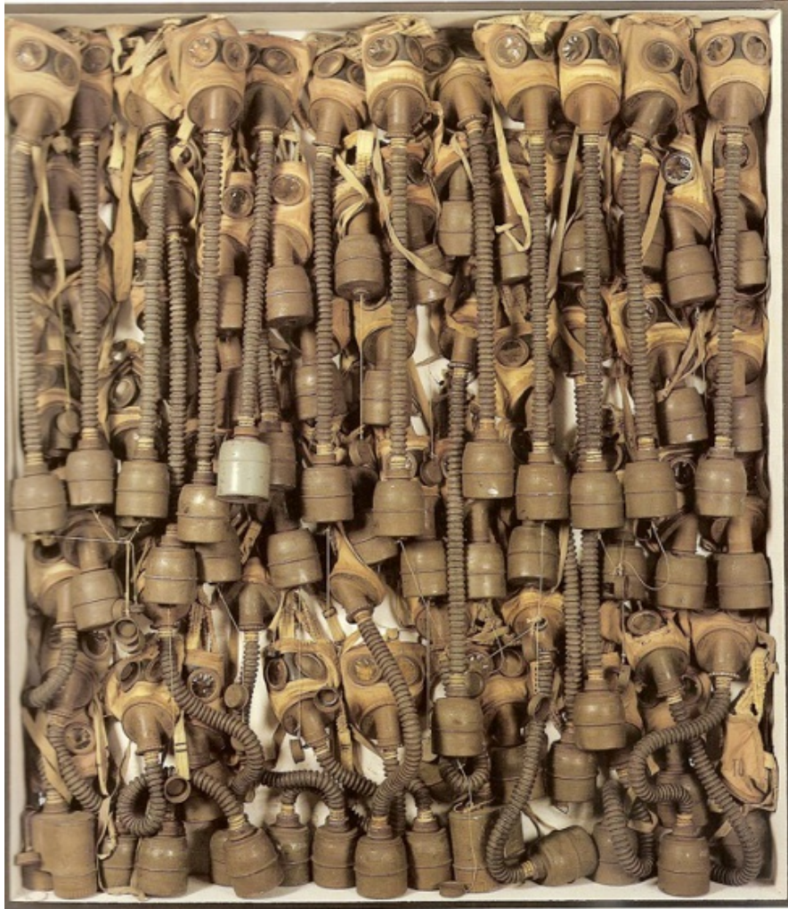
ARMAN (Armand-Pierre FERNANDEZ, dit) Home Sweet Home , 1960, accumulation de masques à gaz dans une boîte, 160x140.5x 20.3 cm, MNAM, Paris