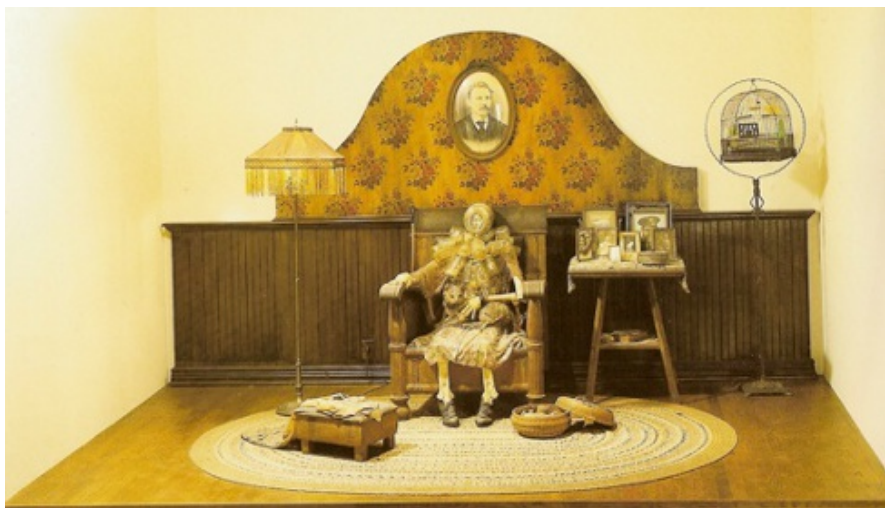
Edward KIENHOLZ The Wait ( l'Attente) , 1964/1965, laque, verre, bois et objets trouvés, 203.2 x 375.9 x198.1 cm, Collection of Whitney Museum of American Art, New York.