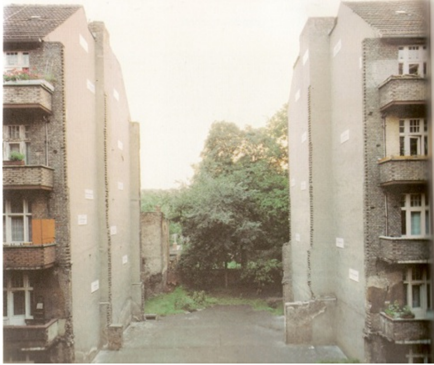
Christian BOLTANSKI La maison manquante , septembre 1990, deuxième partie, le musée Berliner Gewerber Ausstellung, Berlin (ouest).